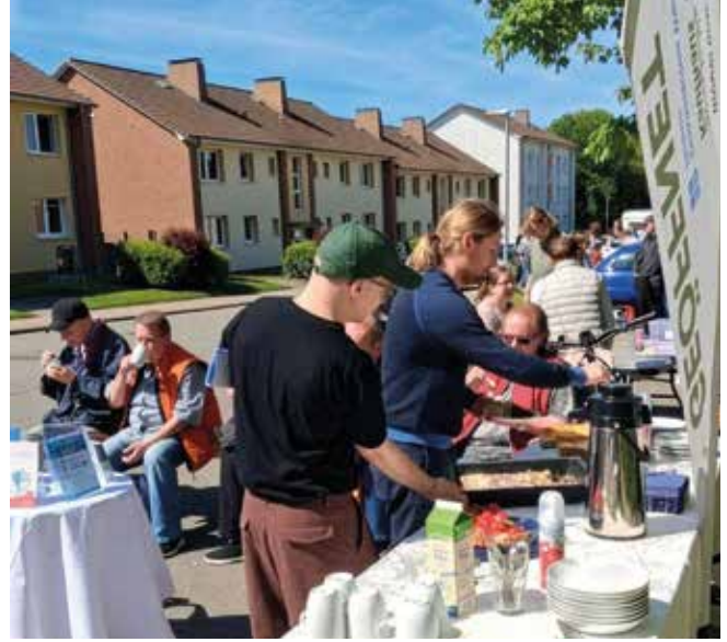
Das Nachbarschaftsfest lud zum Plaudern, Essen und Verweilen ein.

So wurde aus einem sonnigen Nachmittag ein Fest der Begegnung, des Mitmachens und der gemeinsamen Gestaltung. Ein herzliches Dankeschön gilt allen, die mitgeholfen, unterstützt, mitgemacht oder einfach vorbeigeschaut haben. Schön, dass Sie dabei waren! Finanziell unterstützt wurde das Nachbarschaftsfest durch den Verfügungsfonds der Oberen Neustadt und die GEWOBA Nord.