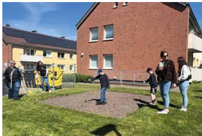
Groß und Klein besäen das vorbereitete Beet mit heimischer Blumensaat.