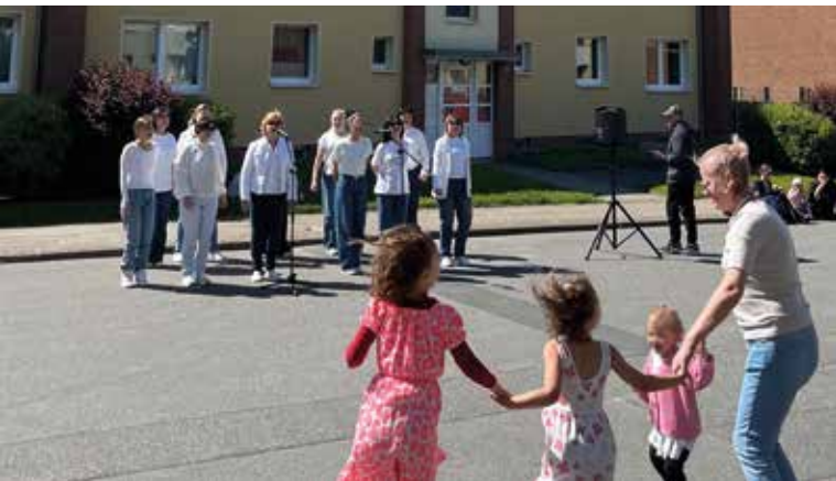
Musik gab es vom Ukranischen Frauenchor und der Band „Besser als Nix“.