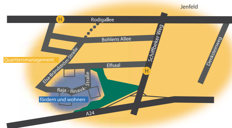
Hier arbeitet das Quartiersmanagement

Bei Regen ist die Sprechstunde im Haus Elfsaal.