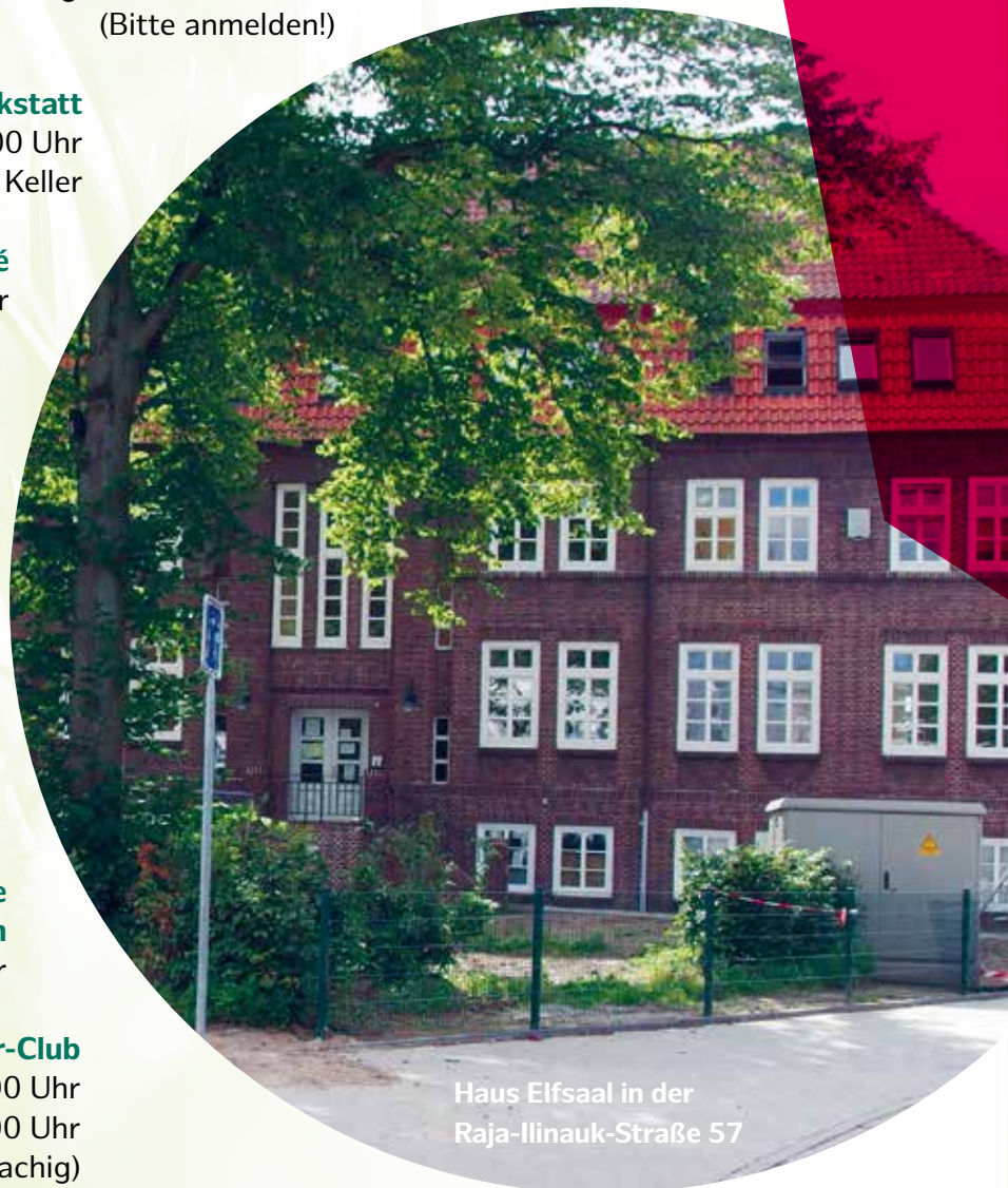
Haus Elfsaal in der Raja-Ilinauk-Straße 57

Dari / Englisch / Arabisch Sonntags 11:00 - 18:00 Uhr