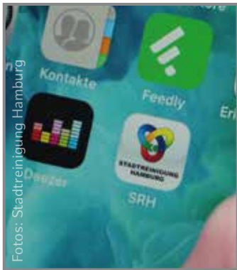
App der Stadtreinigung

An der Bushaltestelle Am Hohen Feld liegt wieder viel Müll? Gemeinsam können wir Elfsaal sauber halten. Die SauberAPP der Stadtreinigung kann sich jeder kostenlos auf das Handy laden. Damit können Sie Müll melden. Das ist ganz einfach! Sie machen ein Foto von der Müllecke, geben den Ort an und können sich informieren lassen, wenn der Müll durch die Stadtreinigung entfernt wurde. Wer lieber telefoniert, kann sich auch an die Hotline Saubere Stadt wenden: 040 2576 1111.