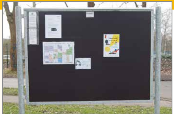
Informationswand an der Kreuzung Elsa-Brändström-Straße/ Elfsaal