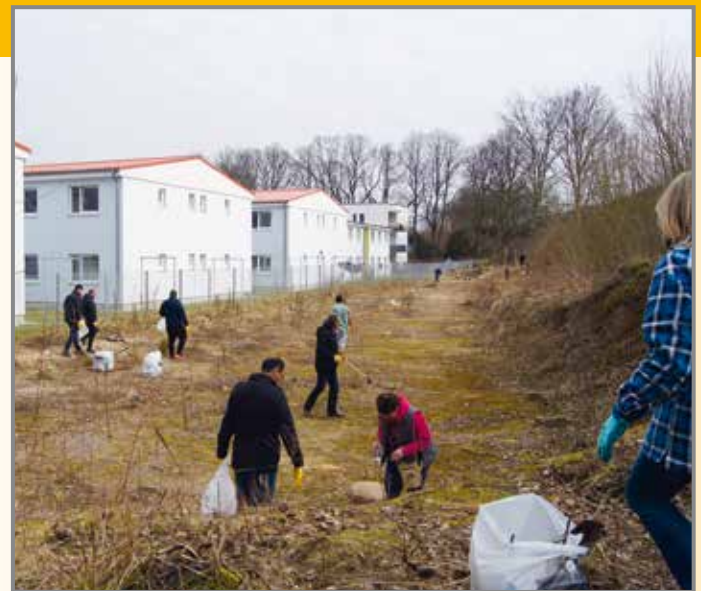
Nachbarn sammeln Müll