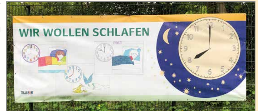
Es gibt vier Planen im Quartier. Auf den Planen steht: Wir wollen schlafen

Es ist Sommer und draußen ist es abends lange hell. Trotzdem beginnen die Tage früh. Kinder wollen ab 20 Uhr schlafen. Sie müssen am nächsten Tag in die Schule. Auch Erwachsene, die zur Arbeit gehen, müssen früh aufstehen. Sie brauchen ihren Schlaf. Bitte nehmen Sie Rücksicht auf ihre Nachbarn.