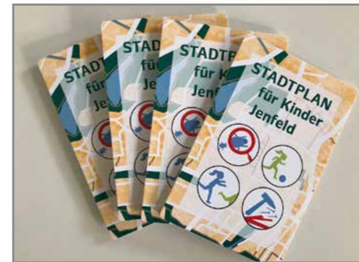
Der Stadtplan für Kinder Jenfeld ist da!

AB JUNI IN DER SPRECHSTUNDE VOM QUARTIERSMANAGEMENT