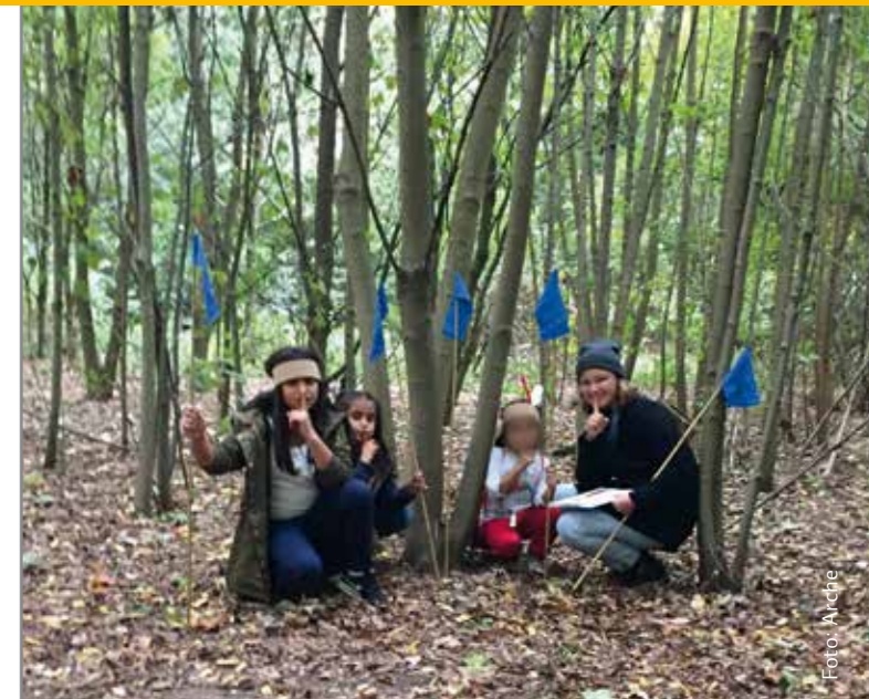
Im Wäldchen können wir gut verstecken spielen. Dabei müssen wir leise sein.