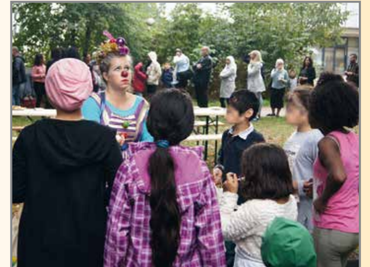
Ein bunter Clown hat gute Laune mitgebracht

Fußball mit dem Sportverein Wandsbeker TSV Concordia