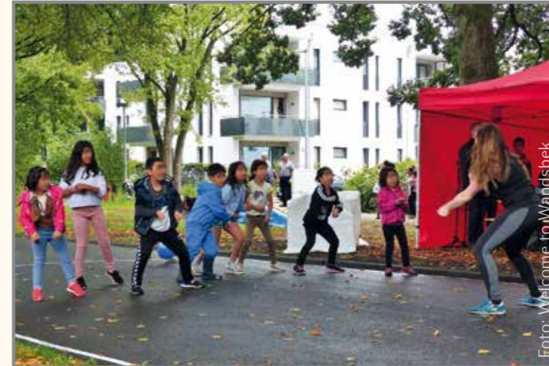
Kinder zeigen Aerobic im Bereich der Bühne