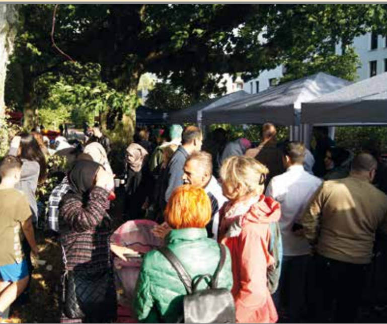
Schlange stehen am Essensbuffet

Am 7. September 2018 haben alte und neue Nachbarn aus dem Quartier Elfsaal gemeinsam gefeiert. Etwa 400 Menschen waren beim Sommerspaß im Elfsaal. Es wurde gegessen, gelacht, gespielt und getanzt. Viele Nachbarn und Einrichtungen aus Jenfeld haben mitgemacht und mitgeholfen. Es gab Musik und tolle Auftritte. Kinder haben Aerobic und Karate gezeigt. Das Fest war – trotz Regen – sehr schön.