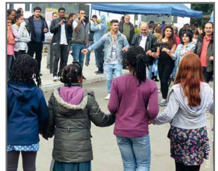
Sommerfest in der neuen Wohnsiedlung

Es war ein schönes Fest! Viele Einrichtungen aus Jenfeld haben dabei mitgemacht. Fleißige Bewohner und Nachbarn sorgten für abwechslungsreiche Speisen und Getränke. Wir freuen uns schon jetzt auf das nächste Mal!