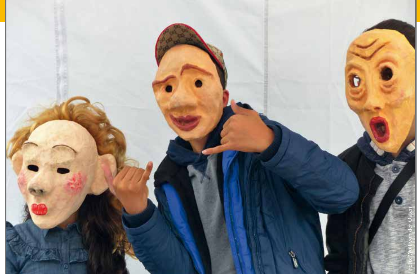
Spaß mit Masken beim Sommerfest